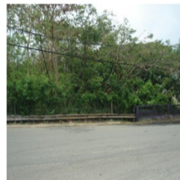
Another front view